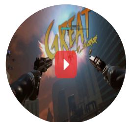
건그레이브VR Trailer 영상