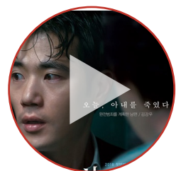
사라진 밤 예고편